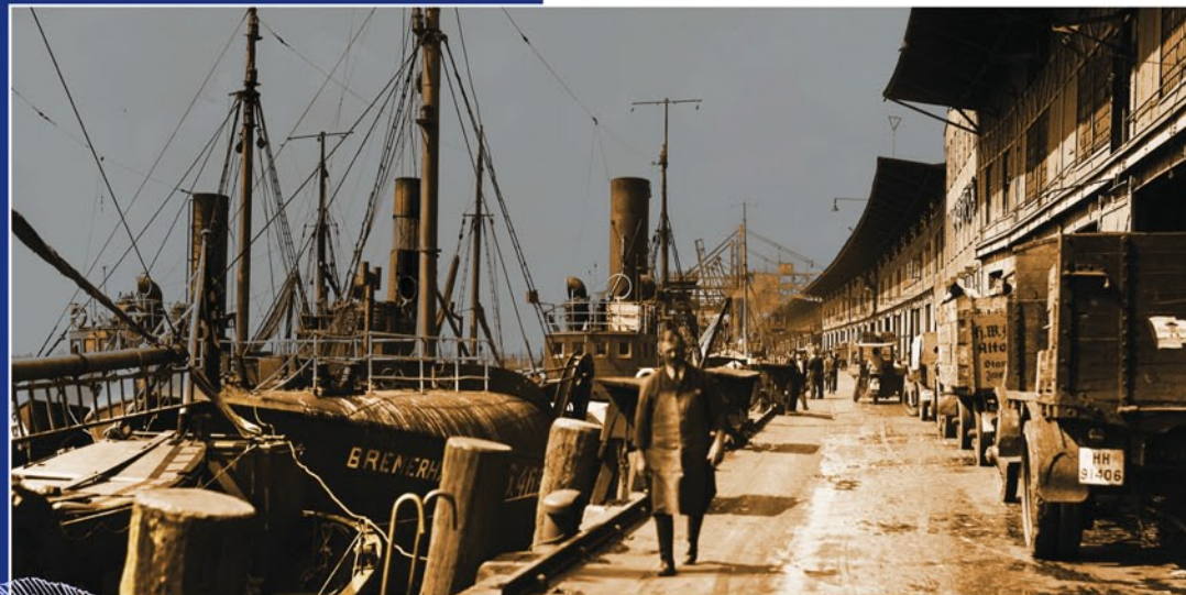
Beschaulichere Zeiten: am Standort des heutigen Elbkaihauses drängen sich die Fischkutter

Groß- und Einzelhändler, Gastronomen, Einkäufer und Händler finden hier täglich ihren Markt. Die unmittelbare Nähe zu frischem Fisch und Meeresfrüchten aus aller Welt lockt mittlerweile aber auch den Verbraucher an die Große Elbstraße: das Quartier wird als lebendige und attraktive urbane Region wiederentdeckt.