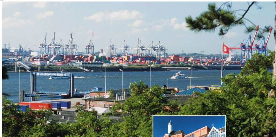
Blick über den Altonaer Elbhang auf den imposanten Container-Hafen

Die Zukunft hat begonnen! In den letzten Jahren hat sich das Altonaer Elbufer zwischen dem pittoresken Övelgönne und dem umtriebigen St. Pauli-Fischmarkt von Grund auf verändert. Die Medien diskutieren die ein-drucksvolle Architektur und das neue, urbane Flair dieses Areals, die städtebauliche 1A-Lage und die lange beschworene architektonische „Perlenkette am Elbufer“.