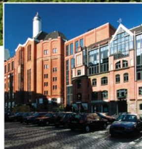
Die neue Shopping- und Gastronomie-Meile beginnt am Fischmarkt

Kleingewerbe, von gründerzeitlicher Industrie-architektur und transparenter Moderne. Dieses Quartier entstand nicht am Reißbrett, sondern die notwendige Neuorientierung geht vorsichtig und bewahrend mit vorhandenen Strukturen um.