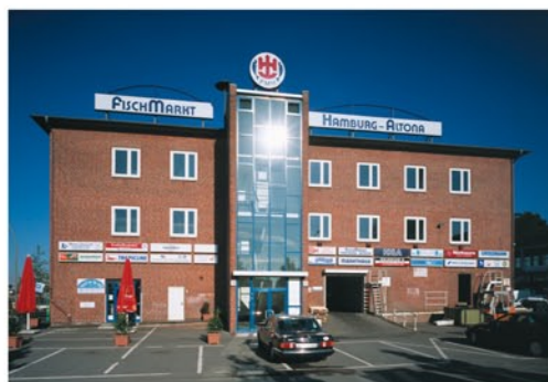
Der markante Kopfbau der Fischmarkt Hamburg-Altona GmbH an der Großen Elbstraße

Der Reiz des Viertels liegt in dem Nebeneinander von High Tech und traditionellem