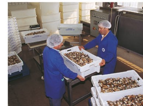
Arbeit von Spezialisten für Gourmets

Die Produktion und Weiterverarbeitung von Fischeinkost hat am Fischereihafen eine lange Tradition. Schon seit Jahrhunderten werden am Elbufer Heringe und Aale geräu-chert oder mariniert.