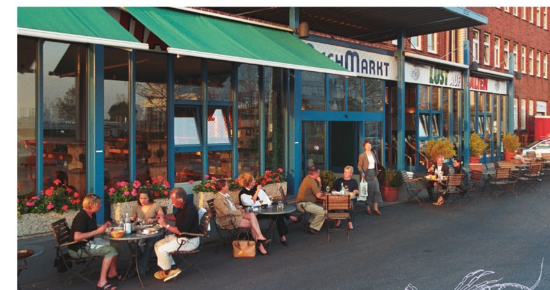
Lust auf den Fischmarkt? Das kulinarische Angebot hat „Weltklasse“

Für Groß- und Einzelhändler, Gastronomen, Verarbeiter und Lagerhalter bietet die Fisch-markt Hamburg-Altona GmbH individuell ausgestattete Räume und Flächen an. Eine entspannte Parkplatzsituation und die schnelle Erreichbarkeit der Autobahn A7, die Nähe zur City sowie das merkantile Umfeld und ein frischer Wind von der Elbe beflügeln die Geschäfte.