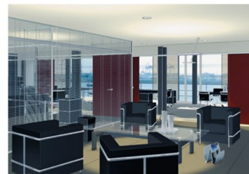
Helle und großzügige Planung für die Umbauphase II des Elbkaihauses

Die systematische Entwicklung und Aufwertung des vorhandenen Immobilien-bestandes sowie Investitionen in hochwer-tige und stilvolle Umbauten kennzeichnen das Niveau des Engagements. Das Elb-kaihaus und die denkmalgeschützte Halle D sind unübersehbare architektonische