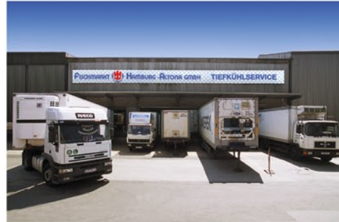
Frishfisch & Meeresfrüchte auf dem Weg zum Fischmarkt

Heute versteht sich die Fischmarkt Hamburg-Altona GmbH als Mittler zwischen Lieferanten, Produzenten und Käufern. Ein Team von erfahrenen Spezialisten sorgt für die fachkundige Aufbereitung und Behandlung der empfindlichen Produkte.